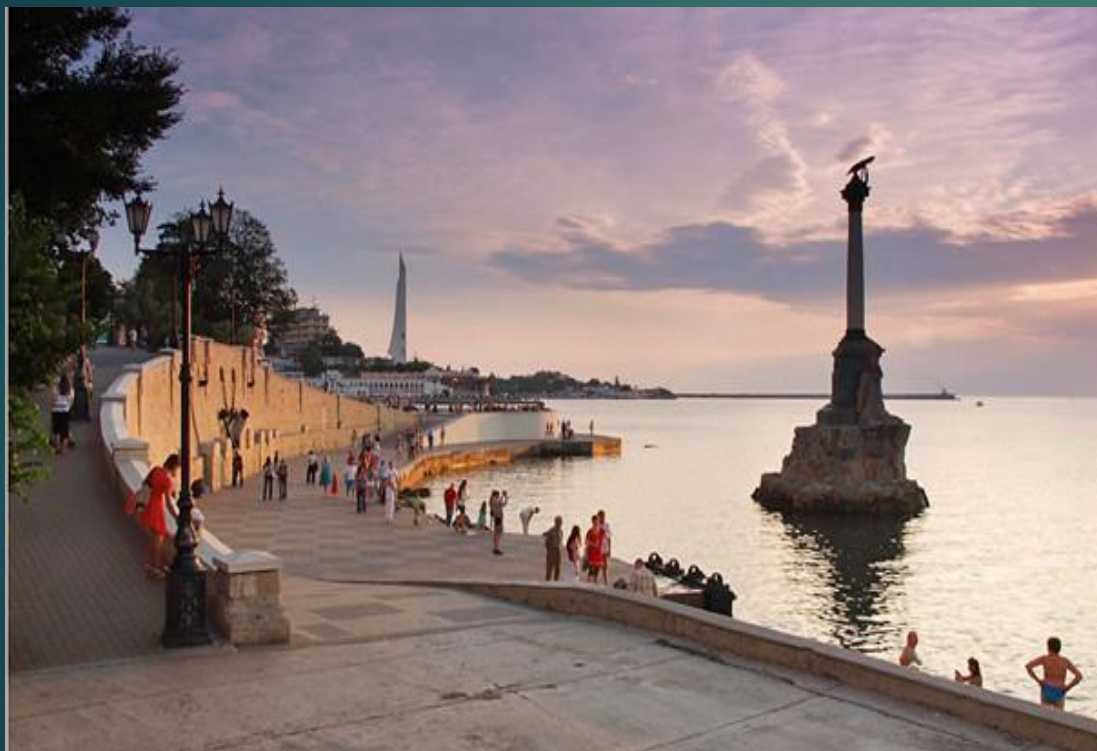
Памятник затопленным кораблям