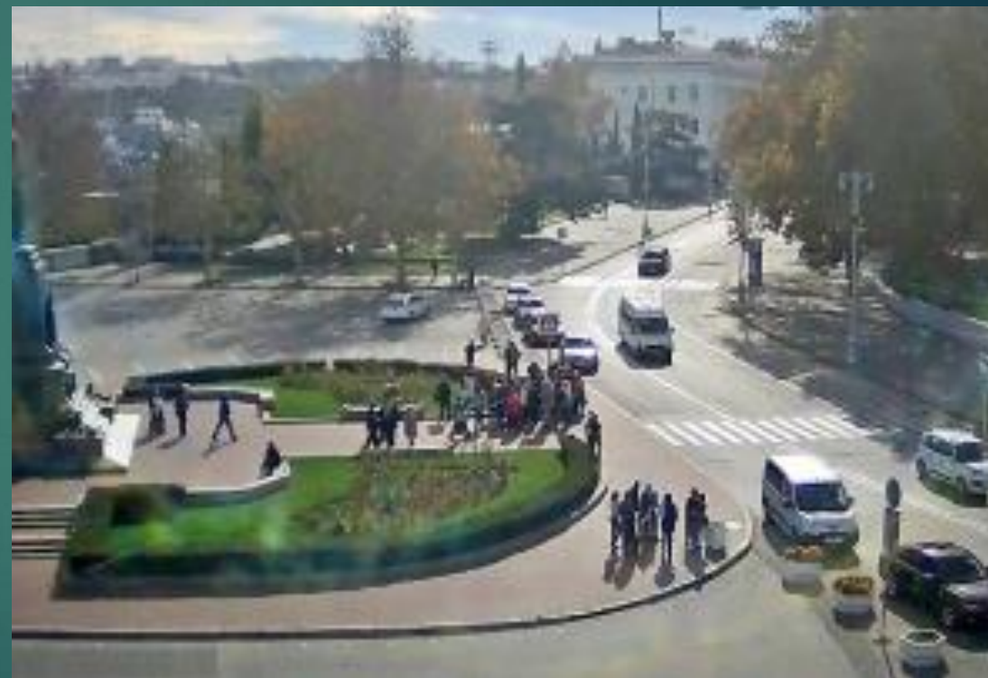
Памятник П. С. Нахимову