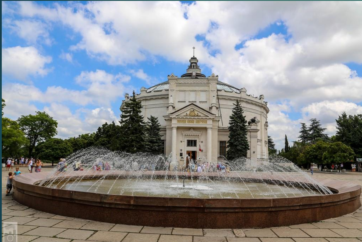
Панорама «Оборона Севастополя 1854-1855 гг.»