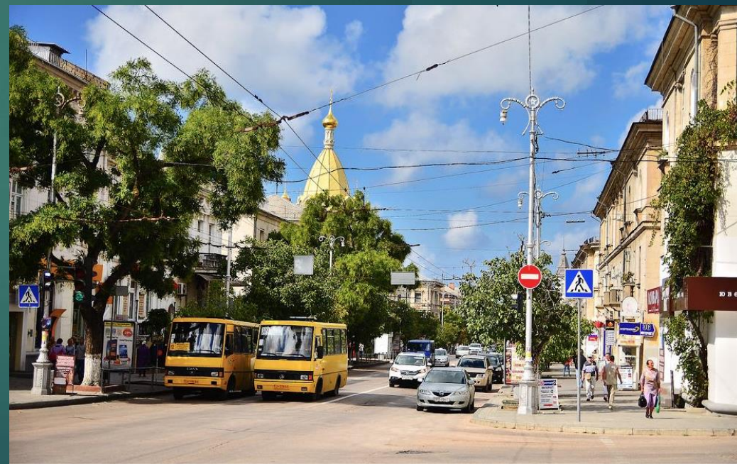
Улица Большая Морская