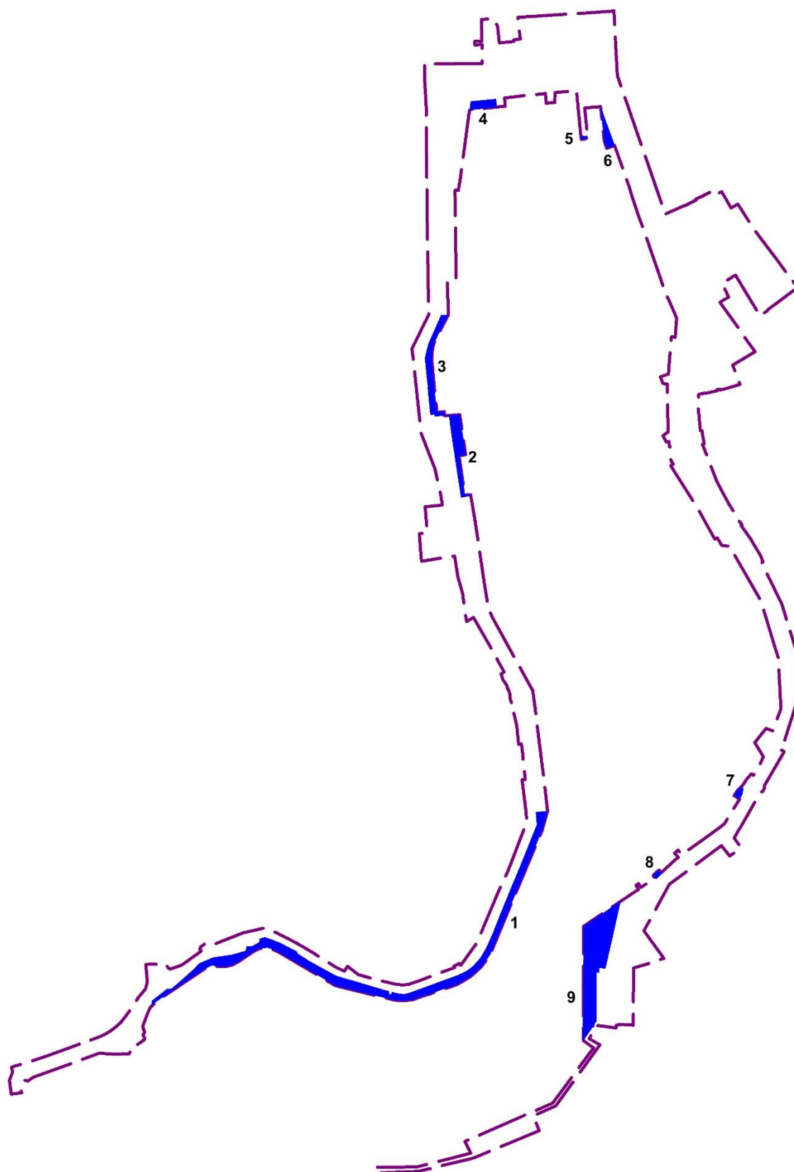
Рисунок 12 – Экспликация территорий, покрытых поверхностными водными объектами