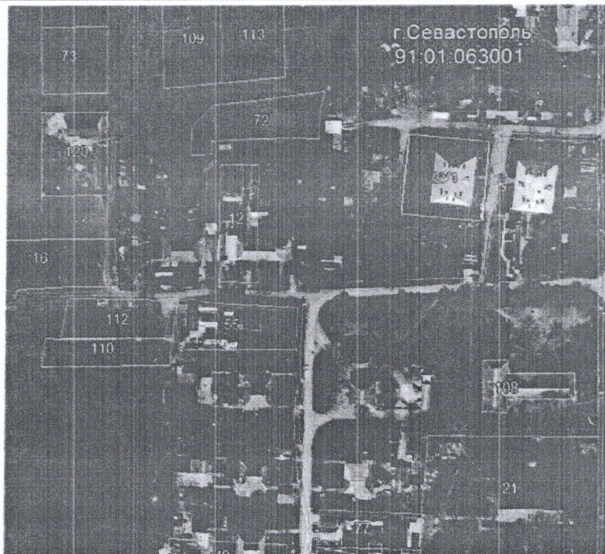
Система координат: СК-63 Масштаб 1:4000